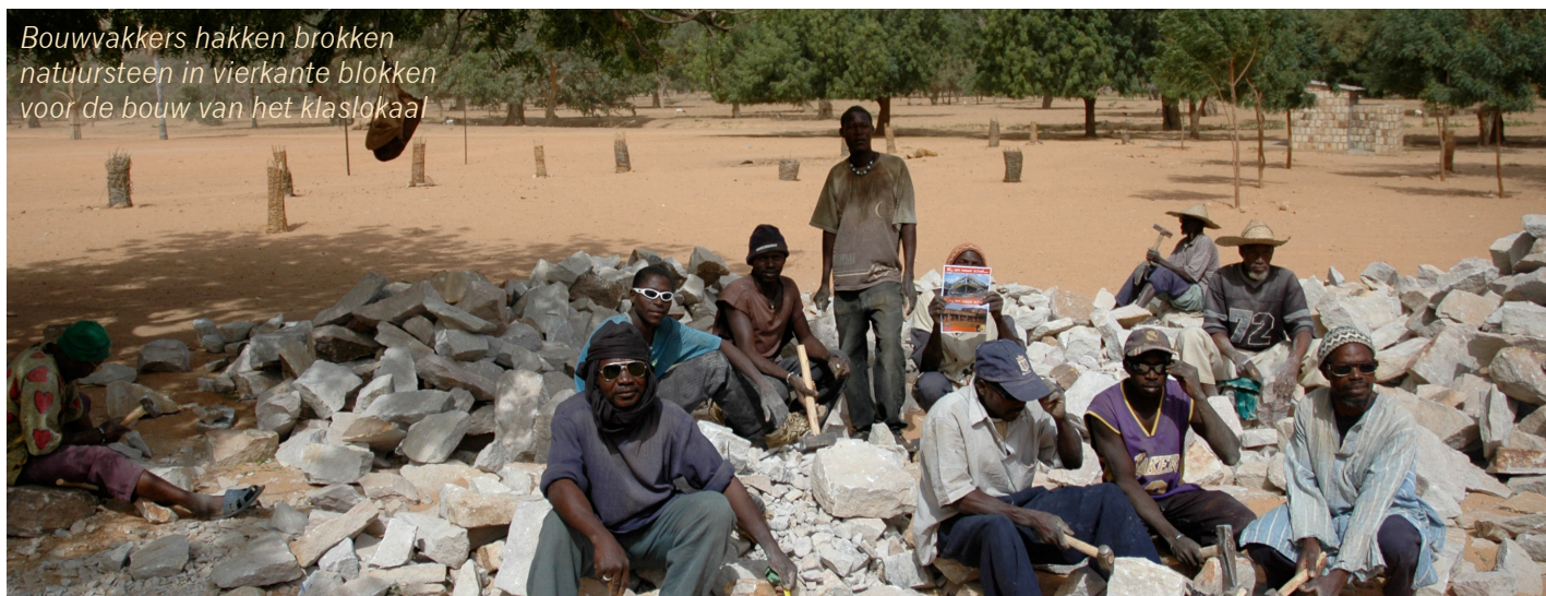
Bouwvakkers hakken brokken natuursteen in vierkante blokken voor de bouw van het klaslokaal